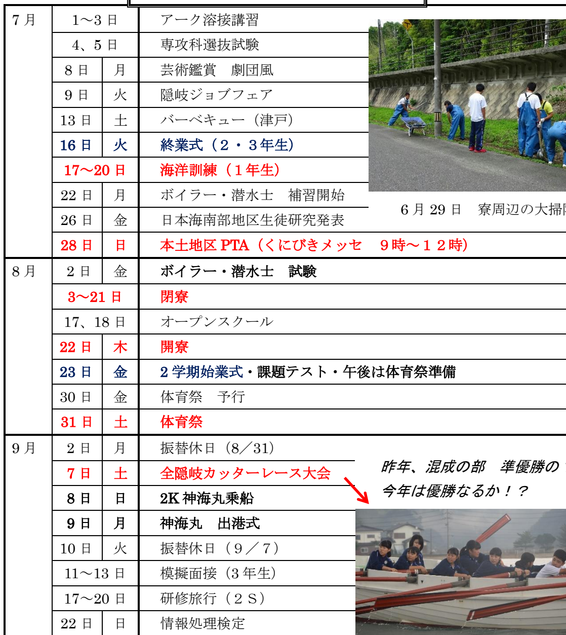
6月29日 寮周辺の大掃除実施