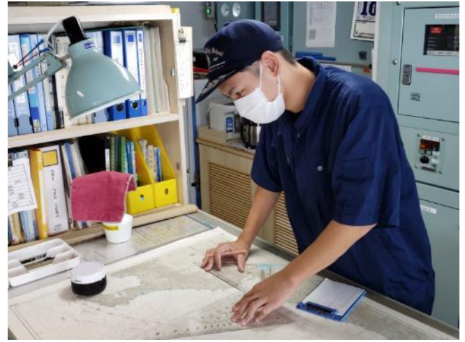
↓当直は専攻科生と一緒に入ります。