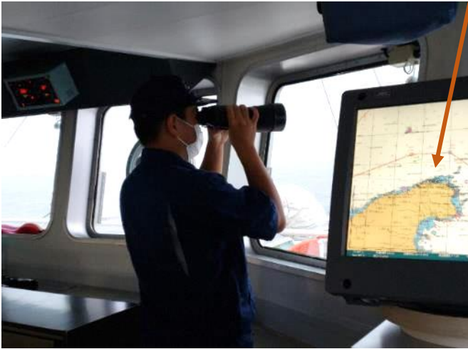
↓当直に入ると最初の15分程度手動操舵を毎回体験。