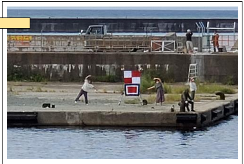
浜田港口に向け航行中、岸壁の端にUW旗発見！ 実習生 敬礼！